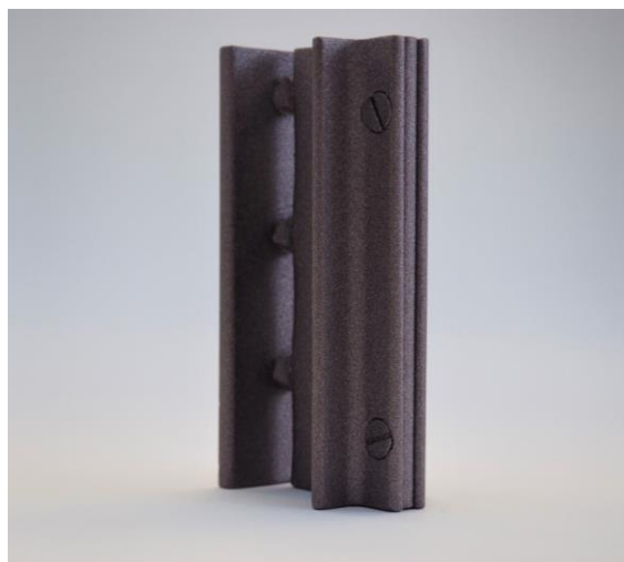
Echantillon du profilé MPH

Ce profilé est un pur produit vendéen : Il a en effet été conçu et mis au point en interne à Challans. Le robot permettant sa fabrication a lui aussi été fabriqué en interne. Aujourd'hui ce profilé est toujours fabriqué dans notre atelier, en Vendée. L'Atelier de la Verrière est donc la seule entreprise française à réaliser ses propres profilés isolants (certifié Made in France IMF depuis 2020).